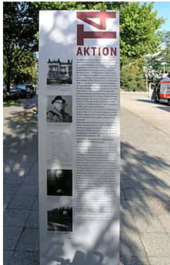
Gedenkstele an der Tiergartenstraße 4

Die Euthanasiemorde in der NS-Zeit oder Aktion T4 ist eine nach dem Zweiten Weltkrieg gebräuchlich gewordene Bezeichnung für die systematische Ermordung von mehr als 100.000 Psychiatrie-Patienten und behinderten Menschen durch SS-Ärzte und -Pflegerkräfte von 1940 bis 1941. Neben rassenhygienischen Vorstellungen der Eugenik sind kriegswirtschaftliche Erwägungen zur Begründung herangezogen worden. Gleichzeitig mit ersten kirchlichen Protesten wurden die Tötungen nach erfolgter „Leerung“ vieler Krankenabteilungen nicht mehr zentral, sondern ab 1942 dezentral, weniger offensichtlich fortgesetzt.