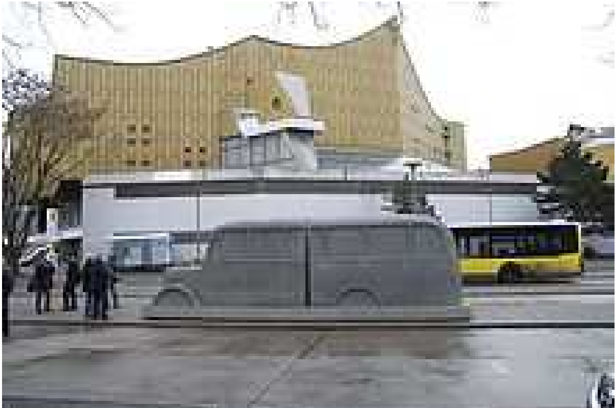
Denkmal der grauen Busse in Berlin, Tiergartenstraße 4

Seit Anfang 2007 gibt es einen Runden Tisch unter der Federführung der Stiftung Topographie des Terrors und der Stiftung Denkmal für die ermordeten Juden Europas , an dem Betroffene, engagierte Bürger, Vertreter verschiedener Einrichtungen und zuständiger Behörden teilnehmen. Die Gruppe hat es sich zur Aufgabe gemacht, auf den aktuellen Missstand aufmerksam zu machen und die Diskussion um eine angemessene, würdige Neugestaltung des Gedenkortes im Rahmen der städtebaulichen Umgestaltung des Kulturforums voranzutreiben. Ein erstes Ergebnis der Arbeit war die zeitweilige Aufstellung des „ Denkmals der Grauen Busse “ am 18. Januar 2008 vor der Philharmonie. Dort wieder abgebaut wurde das Denkmal am 17. Januar 2009. [20]