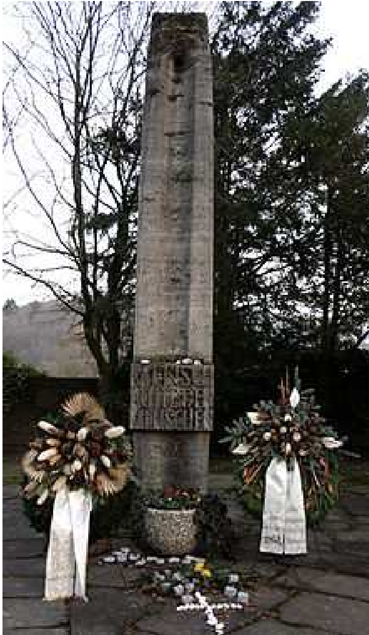
Mahnmal auf dem Friedhof der Gedenkstätte Hadamar

1948 veröffentlichte Alice Ricciardi (bzw. Platen-Hallermund) ihren Bericht über Teilergebnisse des Nürnberger Prozesses: Die Tötung Geisteskranker in Deutschland. Neuauflagen des Buchs folgten erst 1993 und 2005. [22]