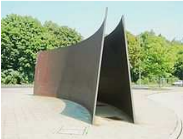
Berlin Curves, Stahl, 1986