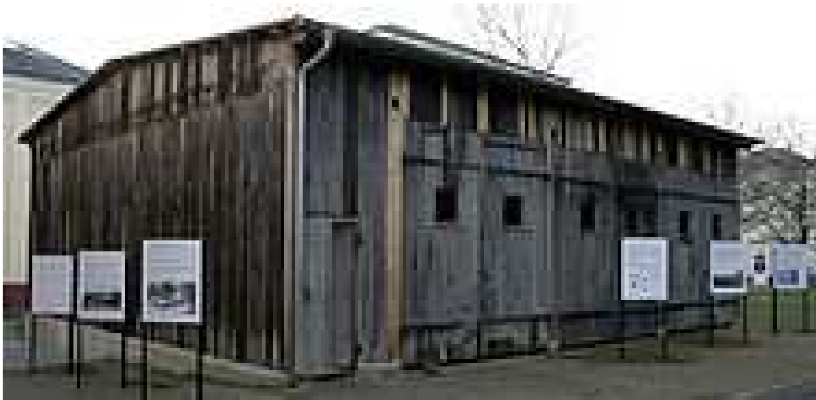
Garage der „grauen Busse“ in Hadamar, mit denen Menschen in die Tötungsanstalt gebracht wurden. Heute Teil der Gedenkstätte.

Da die Kanzlei des Führers im Zusammenhang mit den beschlossenen Maßnahmen nicht öffentlich in Erscheinung treten sollte, wurde eine halbstaatliche Sonderverwaltung gebildet, die formal dem Hauptamt II der KdF, geleitet von Viktor Brack , unterstellt wurde und seit April 1940 in einer Villa in der Berliner Tiergartenstraße 4 untergebracht war und durch den Reichsschatzmeister der NSDAP finanziert wurde. Diese Zentraldienststelle-T4 mit ihrem Geschäftsführer Dietrich Allers war in folgende nach außen hin selbständige Institutionen untergliedert. [5]